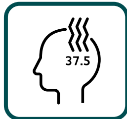
Medição da Temperatura