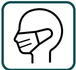
Uso de Máscara

No acesso às instalações é ainda obrigatório o cumprimento das seguintes orientações: