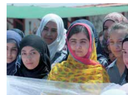
Malala (prémio Sakharov do PE) festeja os seus 18 anos com crianças sírias refugiadas

Os radicais afirmam que é permitido a qualquer muçulmano destruir um ser humano, onde se inclui a traição e a cobardia de matar civis. Quero mostrar a complexidade deste problema, onde se nota a sepa-