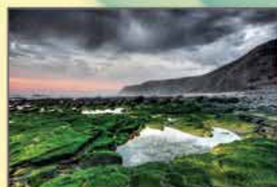
"Ambiência costeira" João Amaro