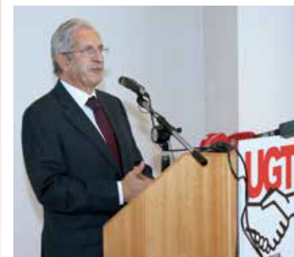
Carlos Tavares: “É responsabilidade de todos não aceitarem fazer coisas que não sejam legais”

“Em Portugal, estamos a fazer o caminho no sentido da nossa credibilidade. E é necessário que todos sejamos rentáveis para que sejamos sustentáveis. Nesse domínio, todo o setor se encontra hoje mais bem preparado. E espero que o diálogo com os representantes dos trabalhadores possa continuar, para bem de todos nós”, terminou Nuno Amado. ■