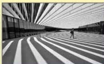
"Entre-linhas" Carlos Santos