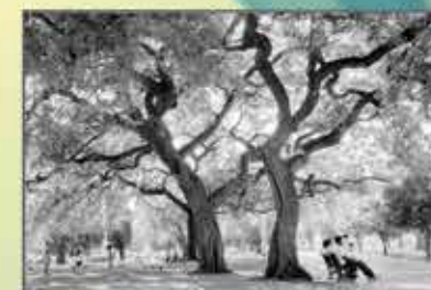
"Jardim de Belém" Ricardo Figueira