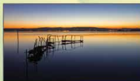
"Amanhecer na Ria" Nélio Cardoso