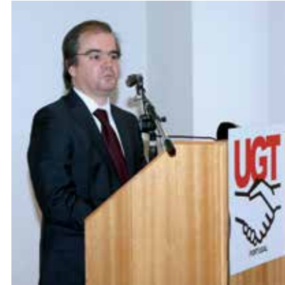
Hélder Rosalino: “Estamos no bom caminho para proteger o nosso sistema financeiro”

A terminar, deixou um aviso àqueles que propõem uma renacionalização da banca: “Não se esqueçam que