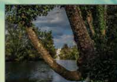
"Trecho do Rio Alva" José Veiga