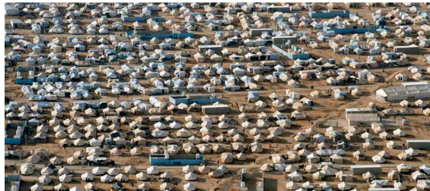
Campo de refugiados na Jordânia

Esta globalização, tal como a conhecemos, está a tornar-se um campo propício para a violência e vários tipos de conflitos