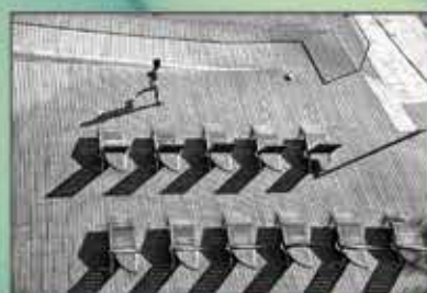
"Sombras" José Pinto