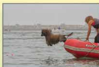
"O Cão de Água Português" Francisco Oliveira