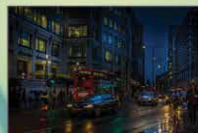
"Uma noite de chuva" Manuel Nunes