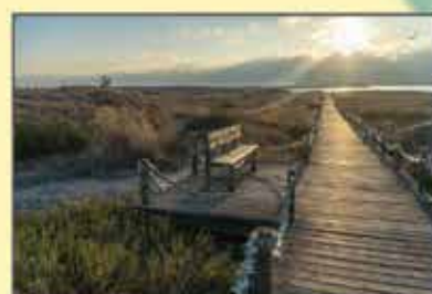
"Adeus Verão" José Pinto