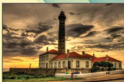
"O farol da Boa Nova" Joaquim Silva