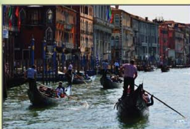
"Gôndolas" Armando Isaac