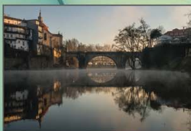
"Bruma de um sonho" Francisco Oliveira