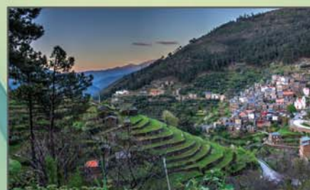
"Paisagem contemplativa" Joaquim Silva