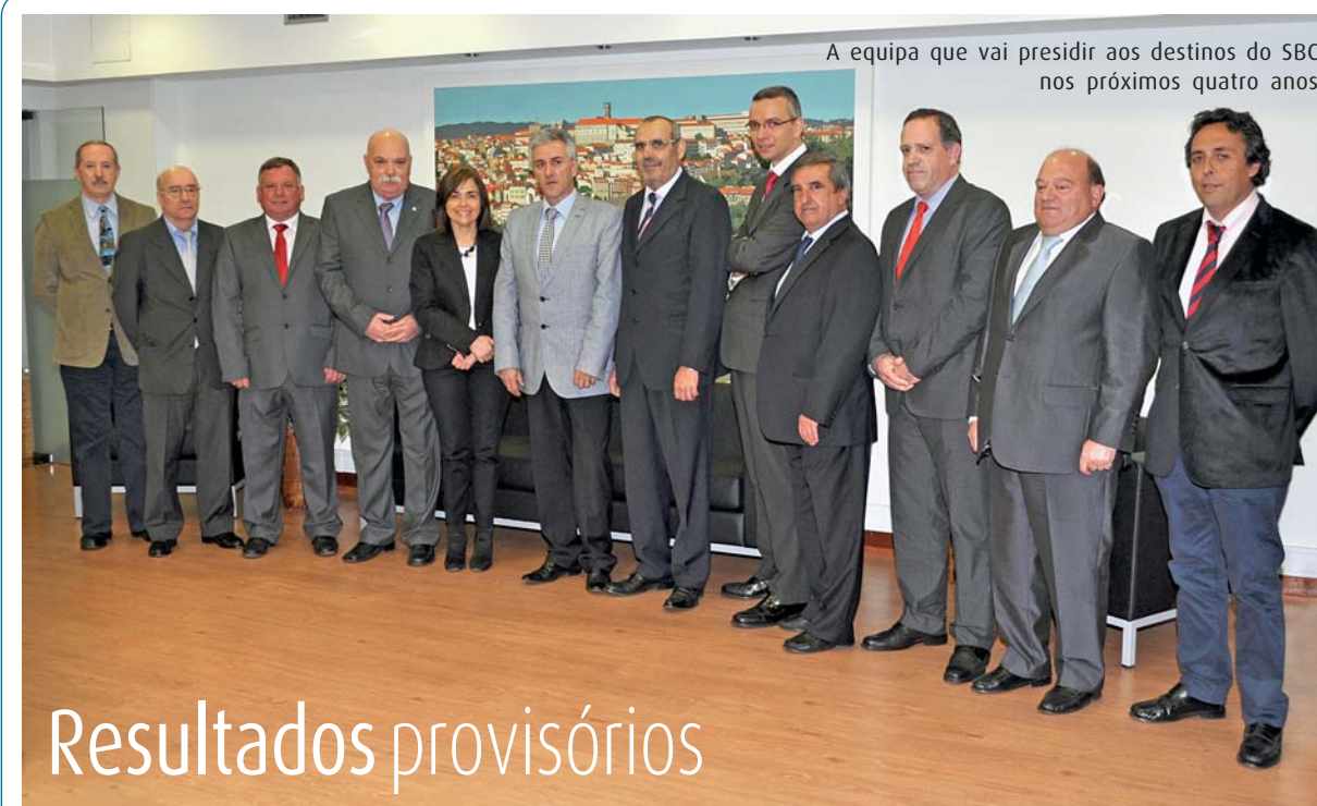
A equipa que vai presidir aos destinos do SBC nos próximos quatro anos

À hora do fecho desta edição, os resultados ainda eram provisórios, faltando apenas conferir os mesmos com as respetivas atas. ■