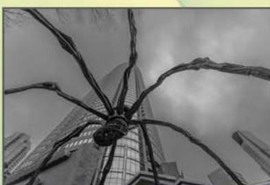
"Perspetiva aracnídea" Rui Gonçalves