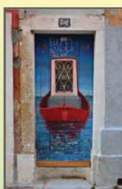
"A minha porta" Armando Isaac