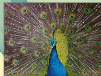
"Beleza natural" Filomena Moutinho