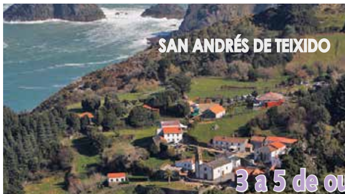
SAN ANDRÉS DE TEIXIDO